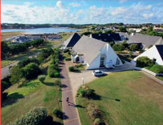
Belambra Club Les Portes de l'Océan***

Le workshop se déroulera sous la forme d'une session unique avec une dizaine d'exposés scientifiques.