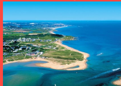
Guidel-Plages – Lorient

Professeur à l'Université Claude Bernard Lyon 1 Laboratoire Ingénierie des Matériaux Polymères (IMP) « Formulation et rhéologie des systèmes polymères fortement chargés »